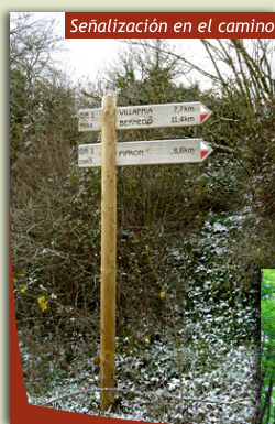
Señalización en el camino